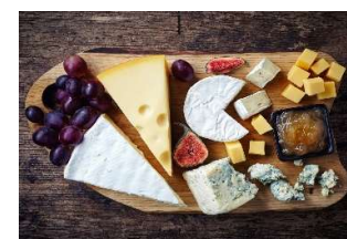
Eksempel på ostefat