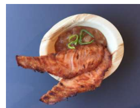
Stekt røkelaks m/hjemmelaget eplemos