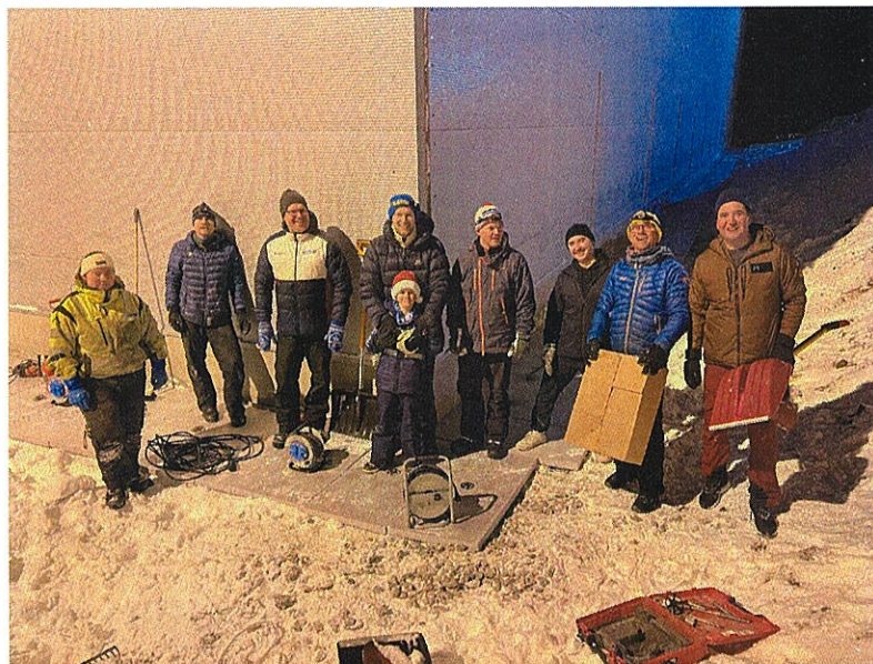
En av mange dugnadsrunder på den nye treningshallen