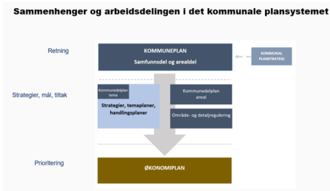
Sammenheng og arbeidsdeling i det kommunale plansystemet. Illustrasjon: Asplan Viak

Som Asplan Viak har illustrert skal Kommuneplanen gi oss en retning mens fag- og temaplaner skal gi oss strategier, mål og tiltak for at vi i økonomiplanen kan prioritere.