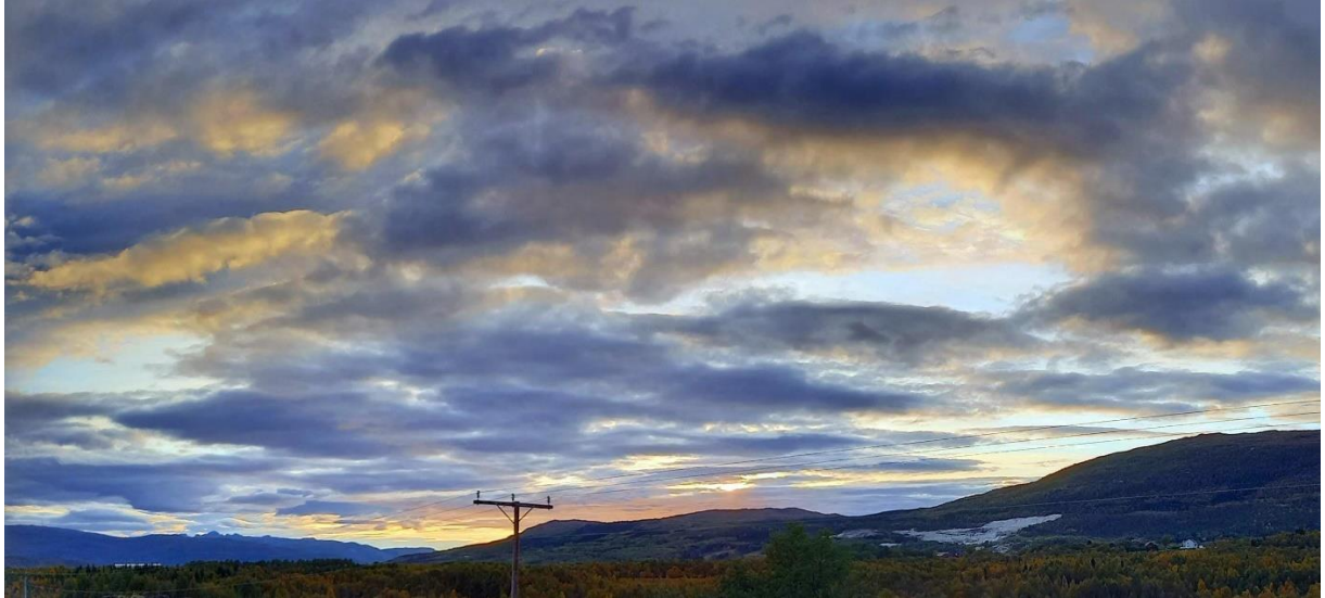
Forsidebilde. Bilde av landskap og himmel i høstfarger, sett fra Holtanveien mot Løgavlen, Fauske kommune.