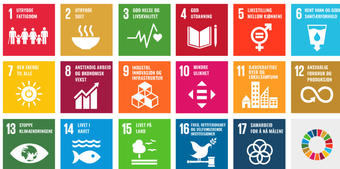
Figur 2. Bilde av FNs 17 bærekraftsmål.

Det er derfor viktig at bærekraftsmålene blir en del av grunnlaget for samfunns- og arealplanleggingen. FNs bærekraftsmål er verdens felles arbeidsplan for å blant annet sikre sosial rettferdighet og god helse, samt å stanse tap av naturmangfold og klimaendringer.