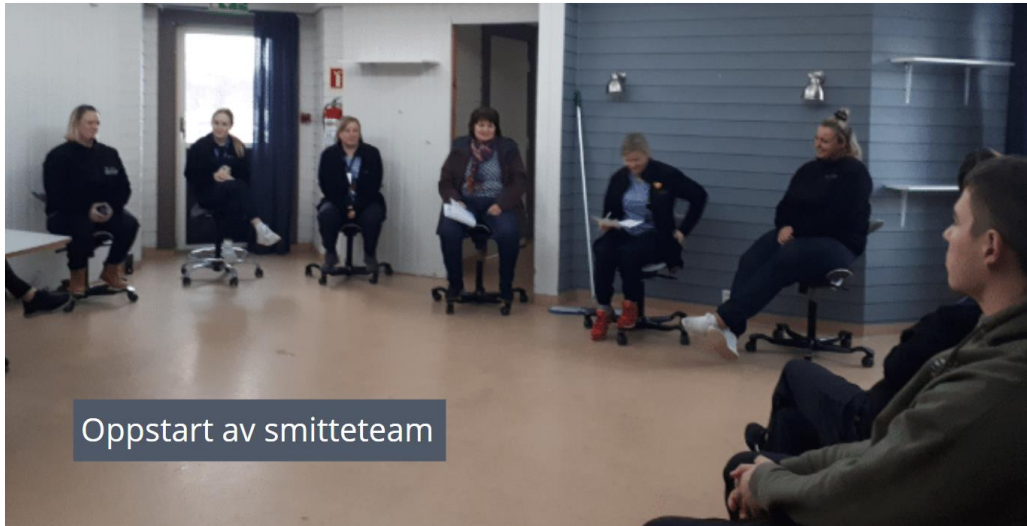
Oppstart av smitteteam

jobber for å være klar hvis vi trenger det