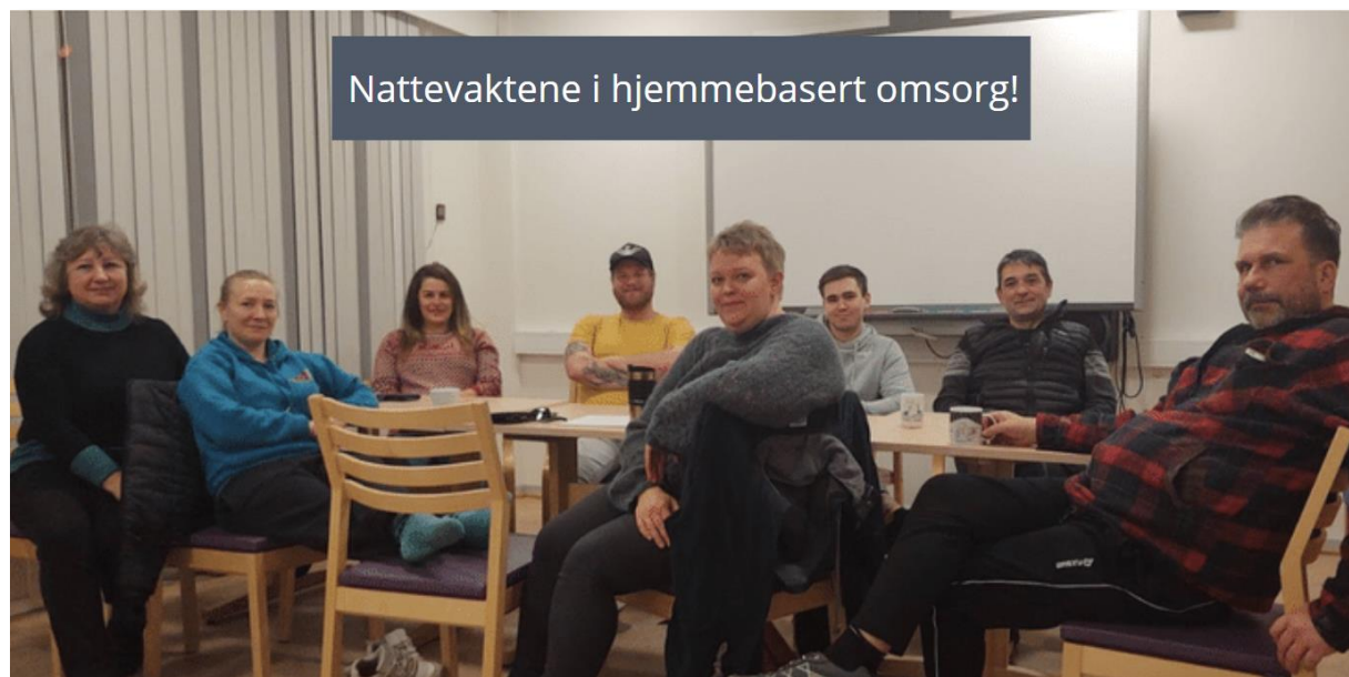
Nattevaktene i hjemmebasert omsorg!

Å være nattevakt er heldigvis noen ganger kjedelig, mens det andre ganger kan være både utfordrende og kreve rask innsats