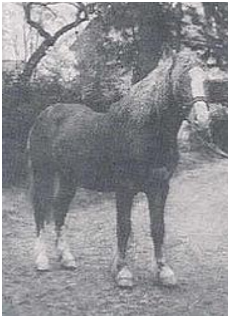
N-linje: Nibbio (Niggl II), f. 1920