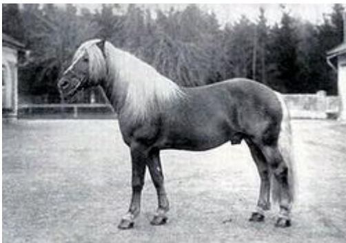
W-linje: 401 liz. Willi, f. 1921