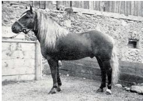
St-linje: 1074 Student, f. 1927