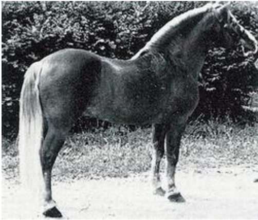
A-linje: 999 Anselmo (Hansele), f. 1926