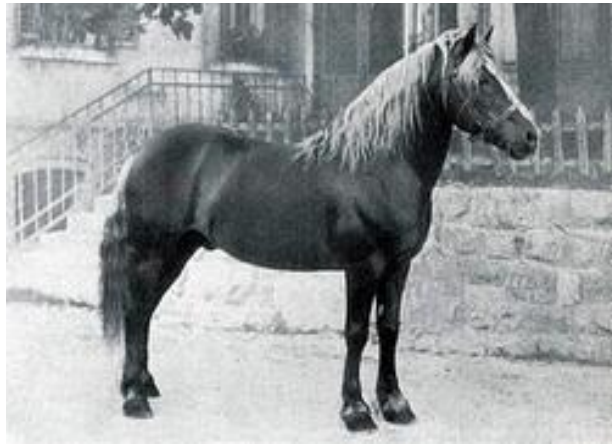
B-linje: Bolzano, f. 1915