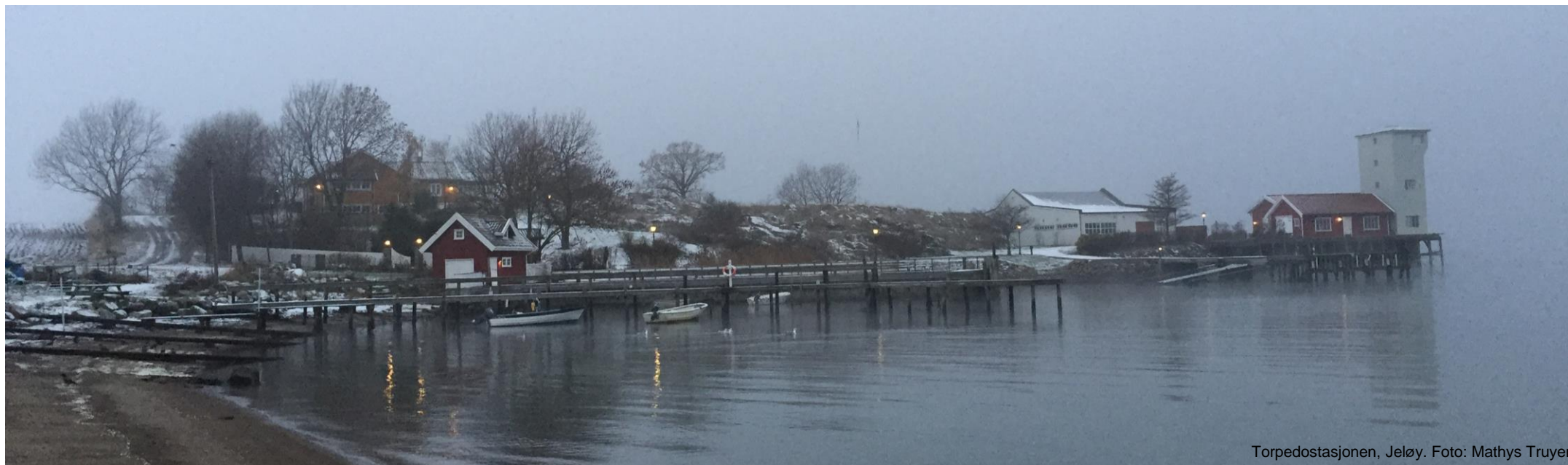
Torpedostasjonen, Jeløy.