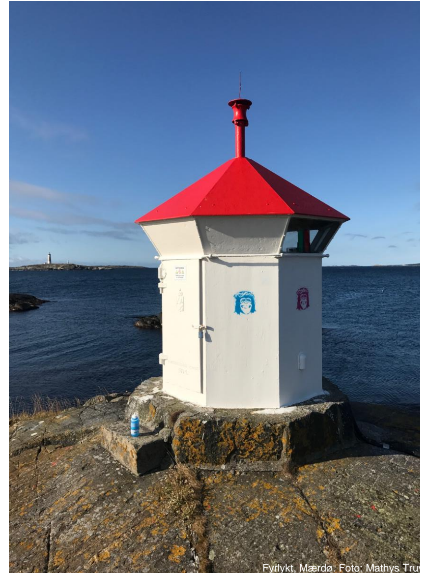
Fyrtøkt, Mærdø.