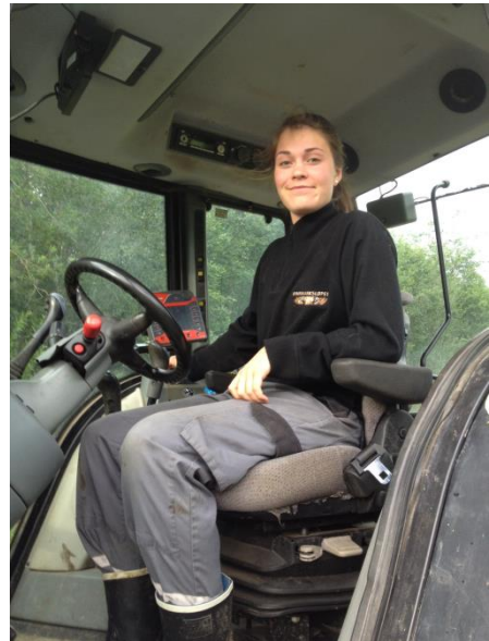
Satse på ungdommen.