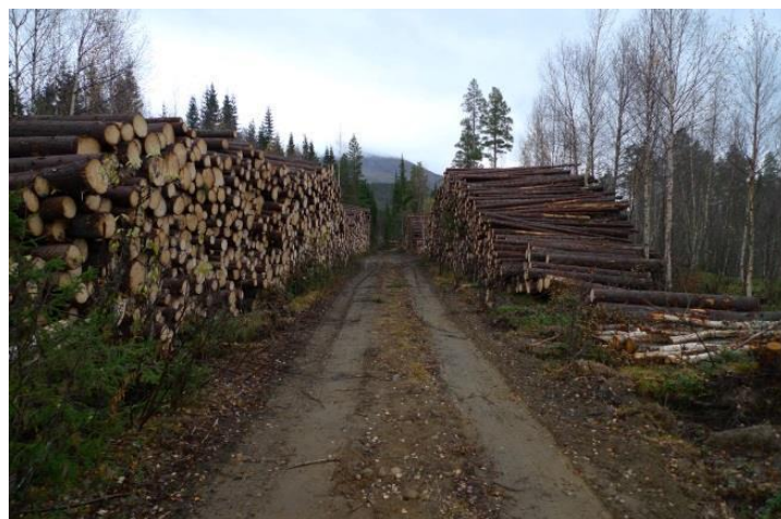
Det er et stort potensiale i skog i Beiarn.