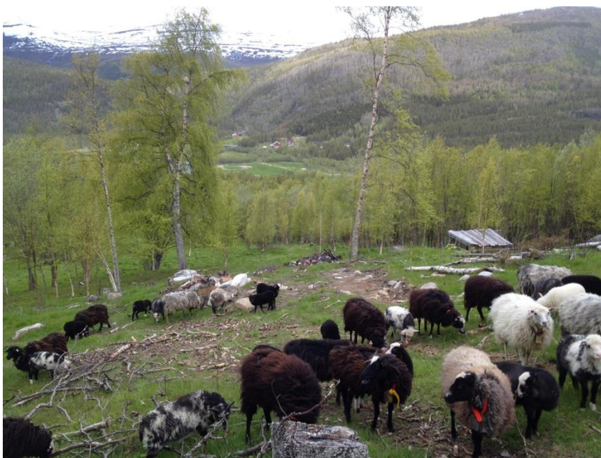
Utnytte landbrukseiendommenes naturgitte ressurser.

Produksjonsmål: Øke melke- og kjøttproduksjonen med 10 % i planperioden.