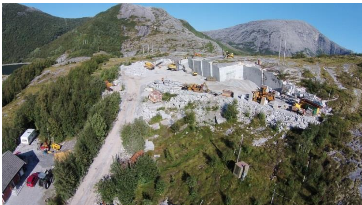
Evjen granitt.