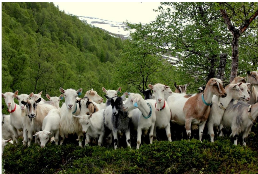
Sørge for at geita og bonden trives i Beiardalen.