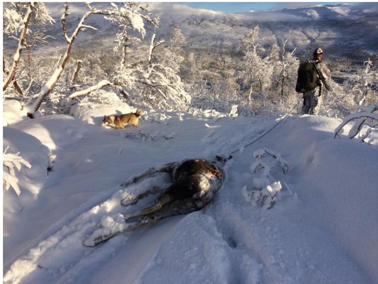
Hjortevilt kan nyttes i næringsssammenheng.