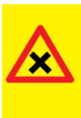
Figur 4-3: Varselskilt for skitrase, fare – kryss

Bilister varsles med bruk av fareskilt «Skiløpere», Statens vegvesen, nr 154, se figur 4-2.