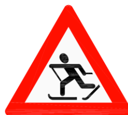
Figur 4-2: Fareskilt nr 154, skiløpere