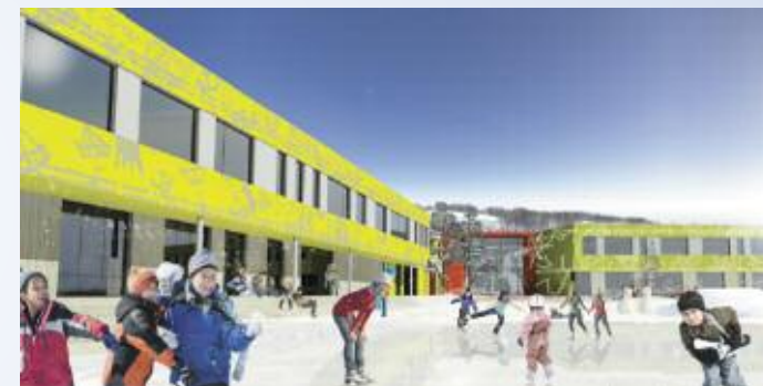
Perspektiv fra sørvest mot skøytebane og fellesrom/kantine