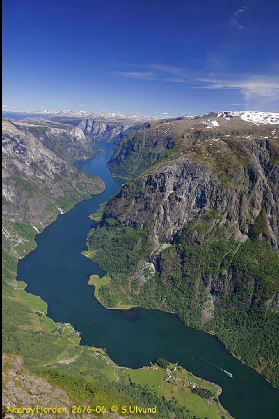
Nærøyfjorden, 26/6-06.