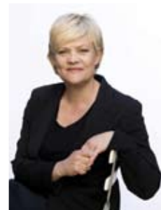
Finansminister Kristin Halvorsen