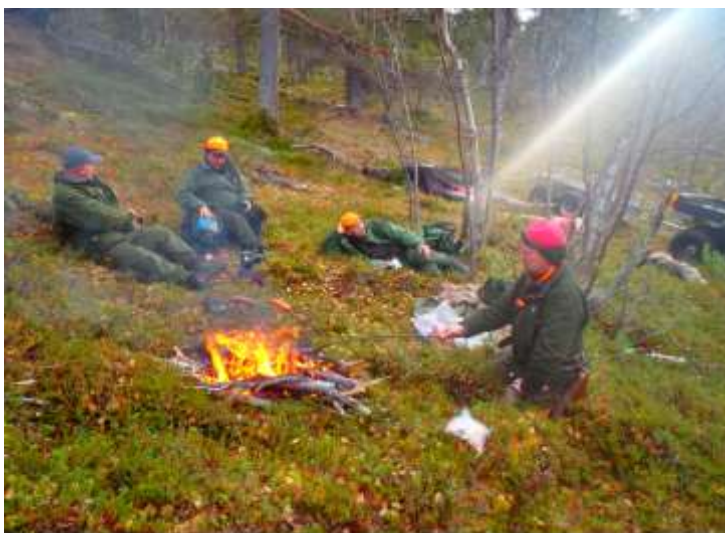
Elgjegere tar kaffepause.

Årets elgkvote er nettopp kunngjort på hjemmesidene www.fefo.no . FeFo kan i år tilby elgjakt i 297 jaktfelt, fordelt på 38.000 km 2 i 14 av fylkets 19 kommuner. Fristen for å sende inn søknad om elgjakt er 30. april kl. 13.00. Jaktlagene oppfordres til å fylle ut og sende søknadene elektronisk.