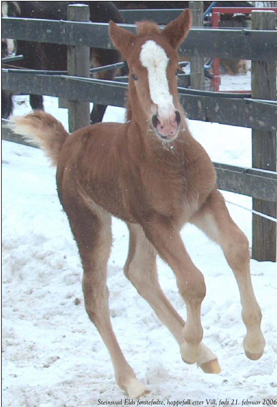
Steinsvad Elds førstefødt, hoppeföll etter Vill, født 21. februar 2006

Som hoppeeier mottok du nyhetsbrev i desember 2005. Der kunne du bl.a. lese om foring av avls hopper og unghest. Ønsker du å lese dette igjen finner du nyhetsbrevet på våre nettsider