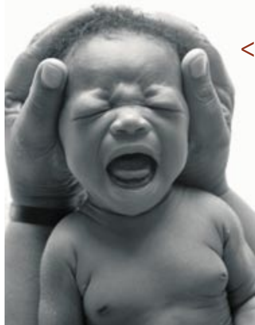
Frelsesarmeen har helseteam som ruller i hardt rammede områder av Sør Afrika, Lesotho og Swaziland. I Kwa Zulu/Natal driver Armeen en helsestasjon der spedbarn testes, veies og vaksineres.

<< gryta, julemusikanter, Fyrlyskorpset, Feltpleien, suppebussen, nattpatruljen, Ensjøtunet bo- og servicesenter og Fretex. Utover vinteren og våren 2004 fulgte han Frelsesarmeen i Melbourne i liknende situasjoner.