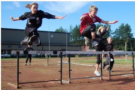
Aktiviteter på friidrettsanlegget ved Hornnes stadion

Hornnes stadion er tilknyttet Setesdal vidaregåande skule og eies av Aust-Agder fylkeskommune. Anlegget består av: gressbane, grusbane, sandvolleyballbane, flerbruksflate i tartan kunststoffdekke med håndball, tennis, volleyball, badminton og basketbaner, 4 stk 60m løpebaner, hoppgrøp og muligheter for trening på spyd, kule og diskoskast. Det er også en fullverdig arena for friidrett med 6 stk 400m løpebane, hoppgrøp, testing, tidtakerbu m.m. I området er det også ei hinderløype. Det er også bygd en "hesteskokast arena".