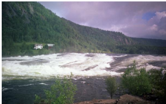
Fennefossen sett fra gravfeltet på Verksmoen.

Otra, med sin sentrale beliggenhet og mange fosser og stryk, er en viktig kilde til friluftsliv og naturopplevelser både for fastboende og tilreisende. Elva og nærområdene brukes til aktiviteter som turgåing, bading, fiske, rafting og padling – mest populært i Syrtveitfossen. Fennefossen ligger like ved tettstedet Evje. Fossen er preget av kulturminner og industrihistorie fra gravfelt fra folkevandringstida til nyere tids kraftverk og smelteverkshistorie. Både Syrtveitfossen og Fennefossen står i dag i fare for ny kraftverksutbygging. Agder Energi har søkt konsesjon for utbygging av Fennefossen med antatt oppstart i 2012.