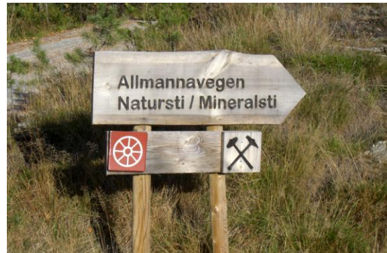
Veiviser ved Oddestemmen parkering

føres i handlingsprogrammet, med en årlig sum i kommunebudsjettet til dette.