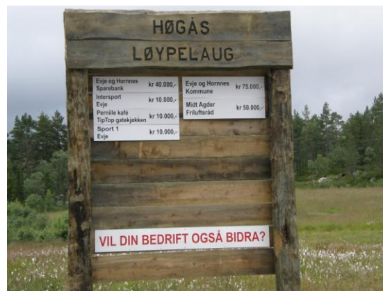
Tavle i Høgås friluftsområde

Fennefosfjellet. Disse vedlikeholdes i dag disse ved hjelp av frivillighet. Ordningen er uholdbar og forsvinner når denne frivilligheten opphører. En må derfor få i stand en tryggere ordning ved at kommunen etablerer faste rutiner for vedlikehold, lagt til driftsavdelingen.