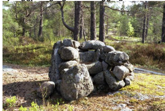
En av de tre bispestolene i Hornnes.

Følgende kulturminner bør prioriteres for synliggjøring og tilrettelegging for friluftsliv: