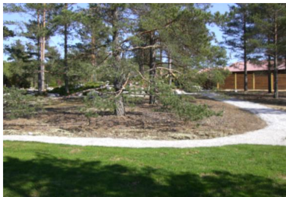
Fra Oddens Hage på Verksmoen

Grøntstrukturen i tettsteder består av et nettverk av arealer: Naturområder, turveinett, gang- og sykkelveier, parker, lekeplasser, idrettsanlegg, grøntanlegg langs ferdselsårer, kirkegårder og private hager. Fontener, bekker, elver og sjøer er også viktige elementer i grønstrukturen. Det er en viktig samfunnsoppgave å sikre og utvikle disse verdiene. Grøntanlegg er også et vesentlig element i et godt nærmiljø, den estetiske formgivning og den moderne tettstedsøkologi.