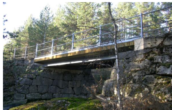
Bru ved Oddestemmen på Allmannavegen.

Det arbeides med å videreføre prosjektet, bl.a. med bedre skilting og utbedringer. Det er etablert ei egen prosjektgruppe med daglig ledelse i Birkenes kommune, med deltakelse fra Evje og Hornnes og Froland. Det er naturlig å ta prosjektet med i prioritert handlingsprogram i planen, både med tanke på spillemidler og andre tilskuddsordninger.