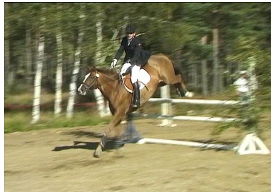
Hindergallop på feltrittbanen på Syrtveit.

Det har vært arrangert flere elite- og landsstevner på Syrtveit, og det er påtrykk fra både forbund og ryttere om å arrangere stevner både på nasjonalt og internasjonalt nivå. Feltrittsbanen er den eneste på Sørlandet.