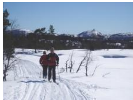
Fra løype Bertesknapen – Årdalsknapen

Løypa er 8,8 km lang og ligger på Forsvarets grunn. Det er avtale mellom kommunen og Forsvaret om vedlikehold og drift av løypa. Løypa er ei helårsløype for alle alderstrinn.