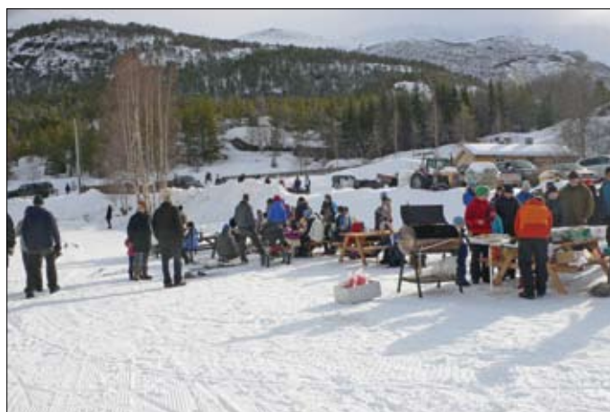
Sosialt fellesskap, servering av lokalprodusert “Bøverburger” og skileikaktivitetar under Vinterfestivalen Bøverbrus 2009.