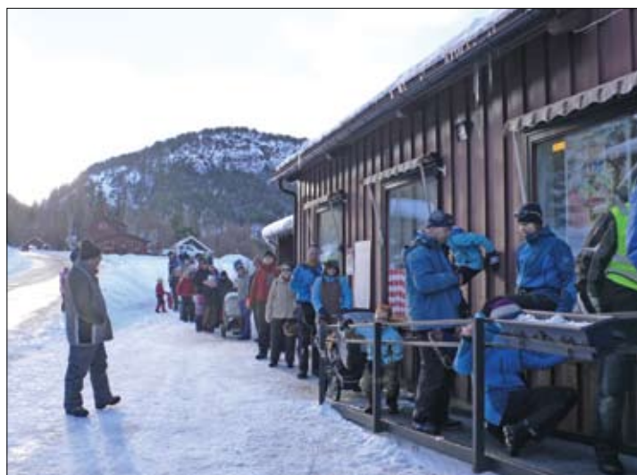
Boverdolane tok Noregsrekorden i butikkø utanfor nærbutikken under Vinterfestivalen Bøverbrus 2009. Køen målte 60 meter!

med regionale, fylkeskommunale og nasjonale mål innan lokalsamfunnsutvikling for å kunne lære av andre prosjekt. Vi har prøvd å vere rausa med å dele erfaringar, og gjennom forprosjektet har det vore mange høve til å dele erfaringane frå Lom med andre – noko som også gjev oss mykje attende i form av attendemeldingar og nye idear.