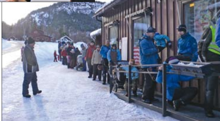
Boverdølane tok Noregsrekorden i butikkø utanfor nærbutikken under Vinterfestivalen Bøverbrus 2009. Køen mälte 60 meter!