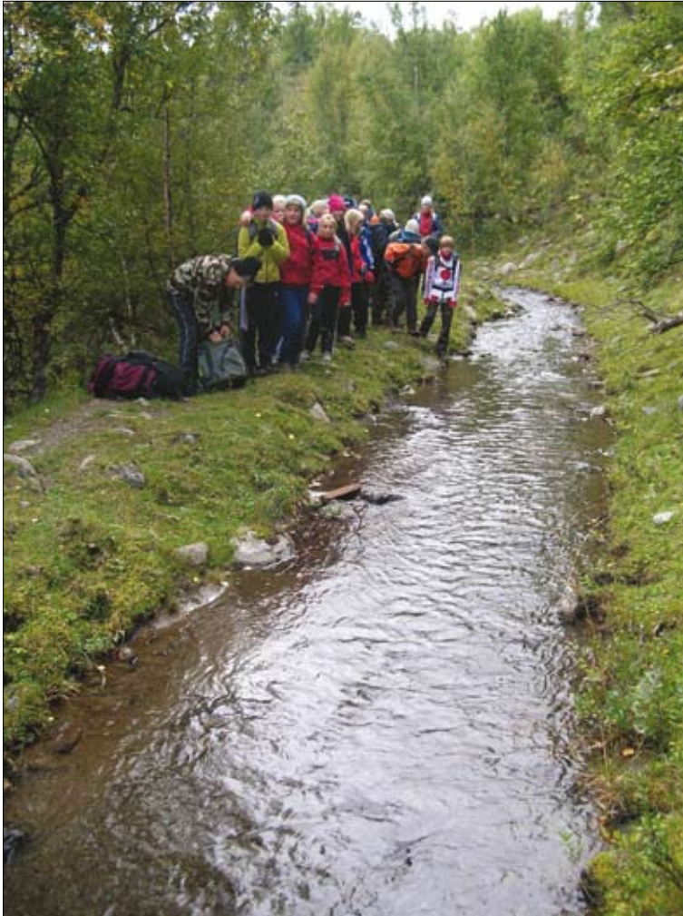
Vatningskulturen står og i ei særstilling som kulturminne i Lom.

mattradisjonane, fjellkulturen, diktarane, Kollavegen, sagasøyla og mangt anna på kvar sine vis også er unike.