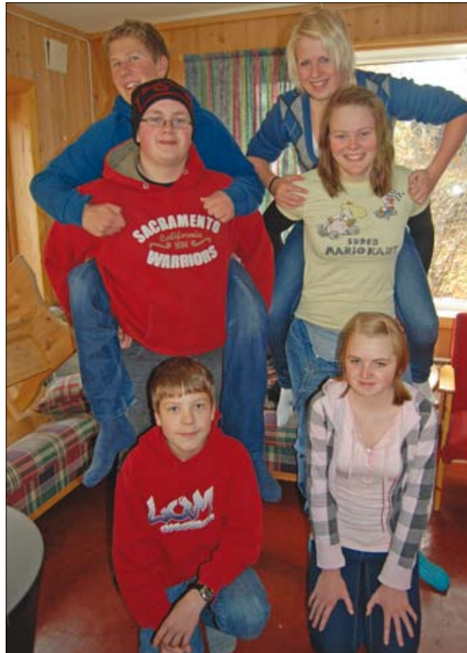
Ungdomsrådet i Lom.

Klubben har ei enkel kioskdirift med sjølvkostprisar. Kvar gong er det ein varmrett på menyen. Det er støtt to vaksne leiarar