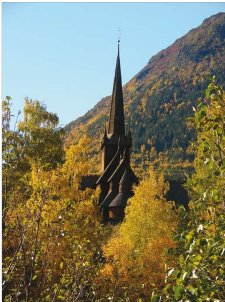
Lomskyrkja, ber i haustprakt, står i ei særstilling som kulturminne i Lom.

Dei to kåra kulturminna er vatningskulturen i Lom og Lomskyrkja . Både kyrkja og vatninga har endra seg mykje i vår tid. Det gjer ikkje dei to mindre viktige som kulturberarar og kulturminne for å fortelje om og minne på kva grunnkulturar og grunnverdiar folk i Lom opp gjennom hundreåra har bygt liva sine, næringsgrunnlaget og bygdesamfunnet på.