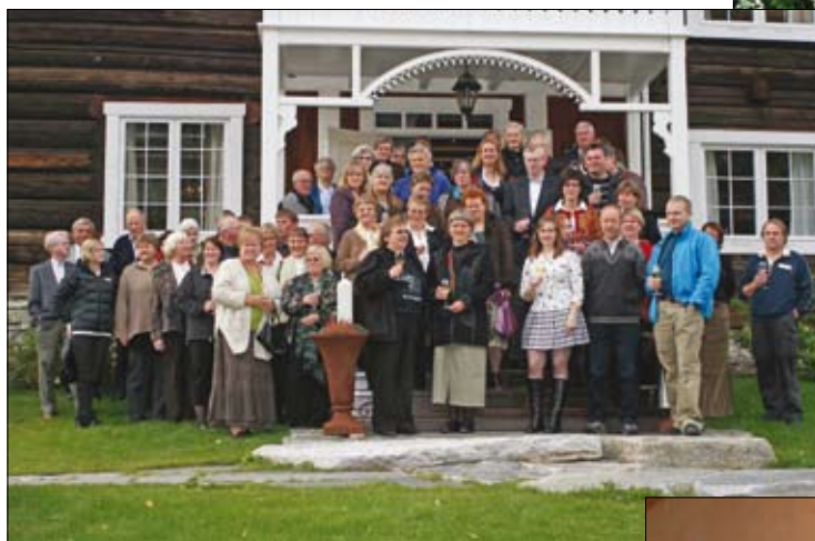
Deltakarar på fest for frivilljuge leiargar i 2007, utanfor staselege Andvord gard.