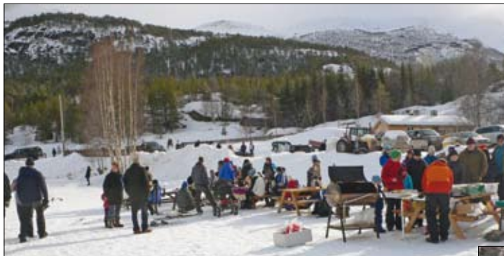
Sosialt fellesskap, servering av lokalprodusert “Bøverburger” og skuleikaktivitetar under Vinterfestivalen Bøverbrus 2009.