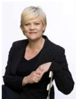
Finansminister Kristin Halvorsen la fram forslag til statsbudsjettet 13. oktober 2009

13. oktober la Regjeringa fram forslaget til statsbudsjett for 2010, og her er nokre korte utdrag frå Regjeringa sin presentasjon av budsjettet: